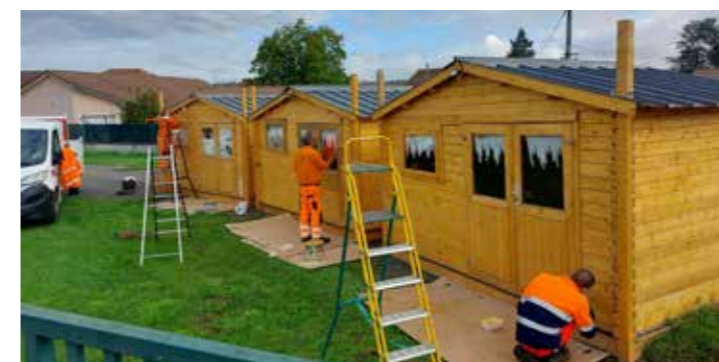
> Lasure des chalets du marché de Noël