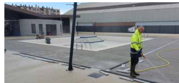
> Nettoyage de la piscine