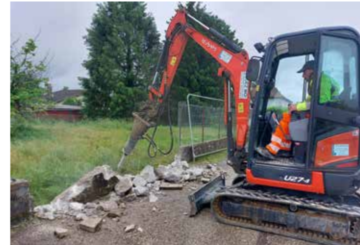
> Terrassement, démolition