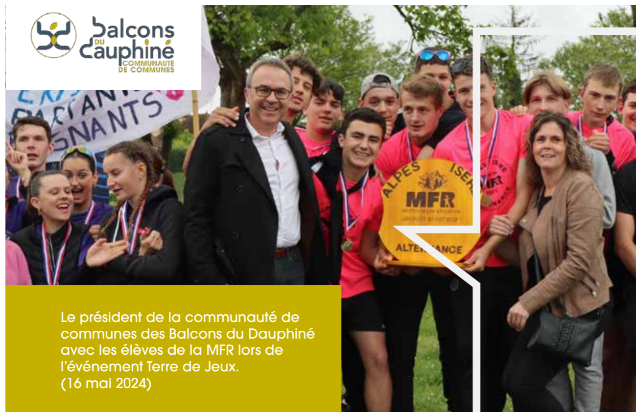
Le président de la communauté de communes des Balcons du Dauphiné avec les élèves de la MFR lors de l'événement Terre de Jeux. (16 mai 2024)