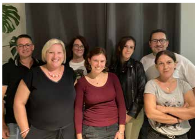
> Le bureau du Sou des écoles pour cette nouvelle année 2024-2025.

Toutes les bonnes volontés sont les bienvenues !