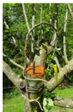
> Atelier de greffe en couronne