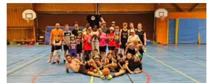
> UB2A tournoi inter générations organisé par le club début juillet 2024

Nous souhaitons monter des équipes séniors (homme et femme) la saison prochaine, donc n'hésitez pas à parler de nous ou nous rejoindre.