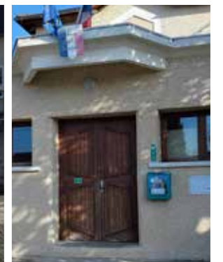
> Mairie de Veyrins > Maison des Associations de Thuellin