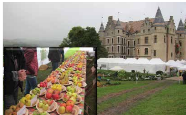
> Exposition au château de Pupetières

Ne possédant pas de verger associatif en local, nous sauvegardons les variétés fruitières anciennes dans les vergers de nos adhérents.