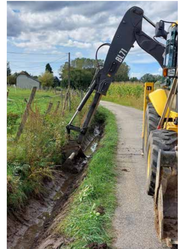
> Curage de fossés