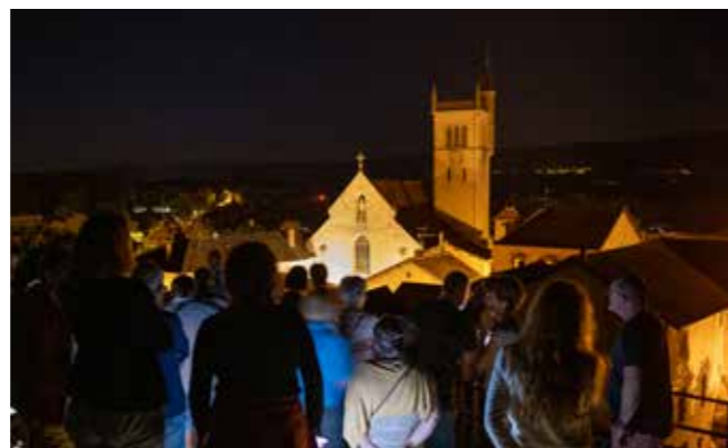
> Visite nocturne Morestel

Contact : 04 74 33 66 22 tourisme@balconsdudauphine.fr www.balconsdudauphine-tourisme.com