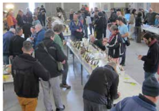
> Bourse aux greffons