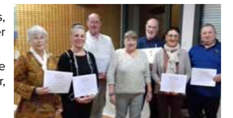
> Remise des diplômes lors de l'AG