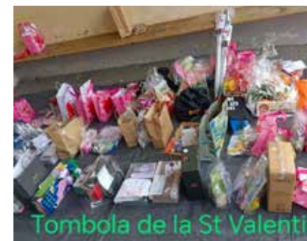
Tombola de la St Valentin

Suivez notre page Sou des Écoles de Curtille et n'hésitez pas à nous contacter.