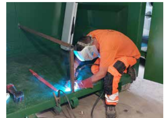
> Aménagement d'une nouvelle berce pour utilisation en 2025