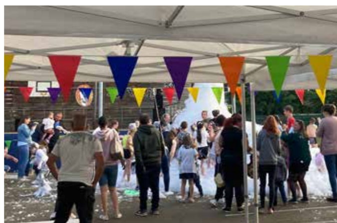
> Kermesse 2024, mousse party pour les enfants.

Sou des écoles de Veyrins Thuellin soudesecolesvt Mail: soudesecolesvt@gmail.com Téléphone : 07 48 11 32 41