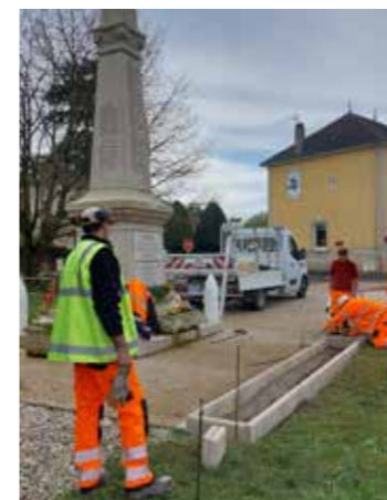
> Massif monument aux morts de Veyrins