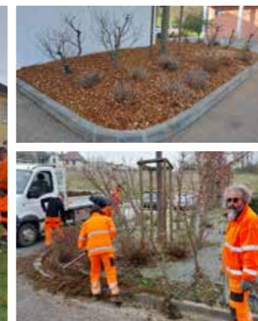
> Paillage des massifs