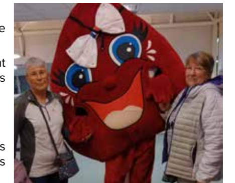
> La présidente et la trésorière au congrès national des donneurs de sang à Bourg en Bresse