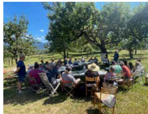
> Atelier de greffe en écusson au verger