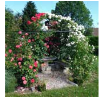
> Le potager et la gloriette

➤ Pour plus d'information ou adhésion, contact : Elyane Peyre 06 44 83 95 26 / rene.peyre@laposte.net