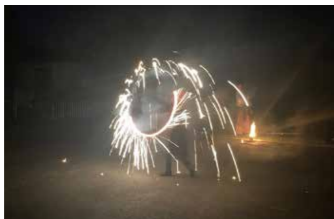
> Spectacle de jongleurs de feu pour clôturer notre kermesse de l'école. > Show qui a émerveillé les petits comme les grands.