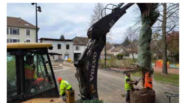
> Installation des sapins de Noël