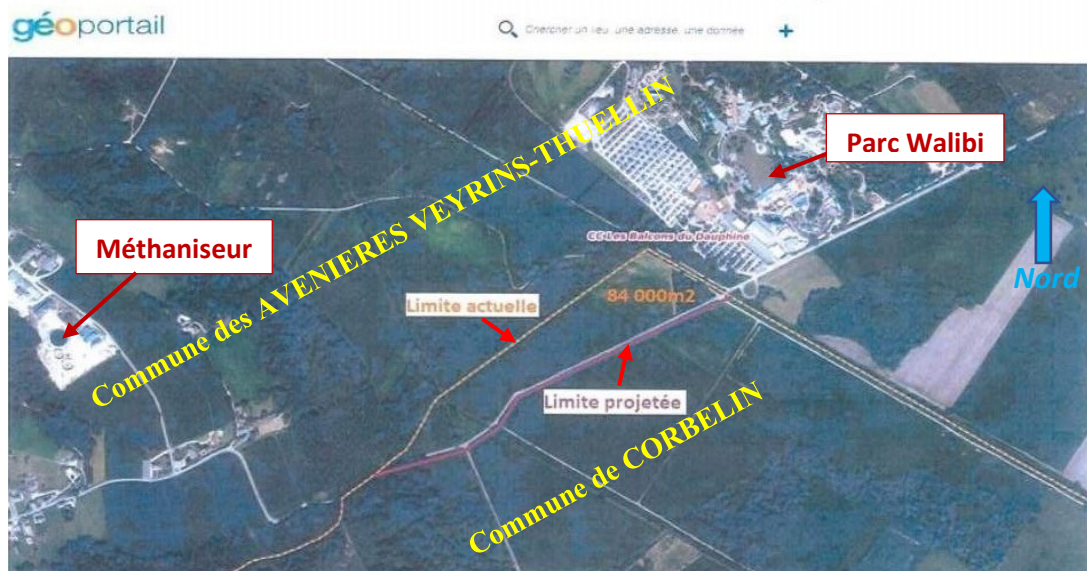
Figure 1 : Photo satellite présentant la limite territoriale actuelle (trait tiret jaune), entre les 2 communes concernées par le projet de modification, et la limite projetée incluant la route du Pont de la Corneille (trait plein violet) ( Source : Géoportail – IGN - Extrait du dossier d'enquête publique des Avenières Veyrins-Thuellin, complété).